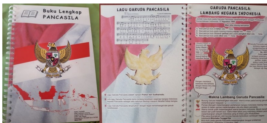
Gambar 1. Halaman kover depan, halaman 1 dan 2 pada BuLe Pancasila

Langkah awal dalam penelitian ini adalah merealisasikan rancangan media Buku Lengkap Pancasila. Media terbuat dari akrilik transparan dengan ketebalan 1,5 mm dan berukuran 30 cm x 42 cm, konten dicetak pada halaman-halaman menggunakan teknik UV printing . Pada halaman kover terdapat bagian berlubang berbentuk Garuda Pancasila, namun dapat terlihat gambar Garuda Pancasila yang tercetak pada lembar berikutnya, seperti tertampil pada Gambar 1. Gambar Garuda Pancasila ini dapat dilepas dari tempatnya karena berbentuk puzzle . Siswa dapat melepas dan menyusun kembali puzzle Garuda Pancasila, sambil menghitung jumlah bulu-bulu pada Garuda Pancasila yang sangat berhubungan dengan hari Kemerdekaan Indonesia.