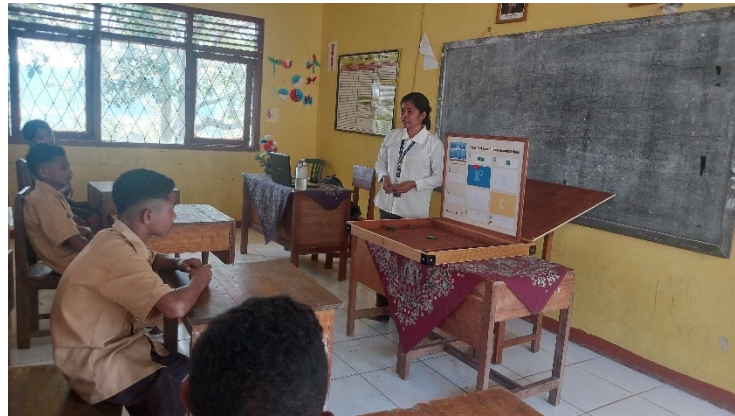
Gambar 1 Penjelasan Cara Penggunaan Kotak KABA

Penelitian diawali dengan memberikan siswa soal \neg pre-test terlebih yang berjumlah lima soal dengan bentuk isian singkat tentang Aljabar suku dua dan suku dua. Setelah itu, siswa dijelaskan mengenai cara penggunaan media Kotak KABA.