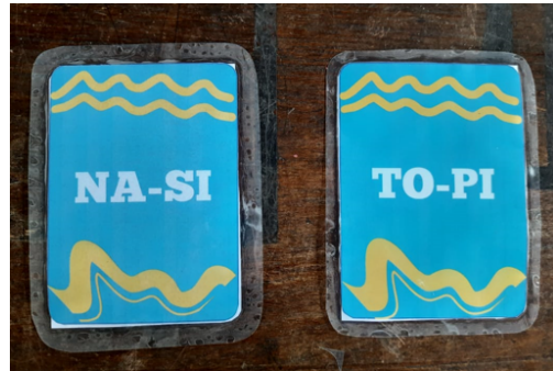
Gambar 2: Contoh tampak bagian belakang kartu.