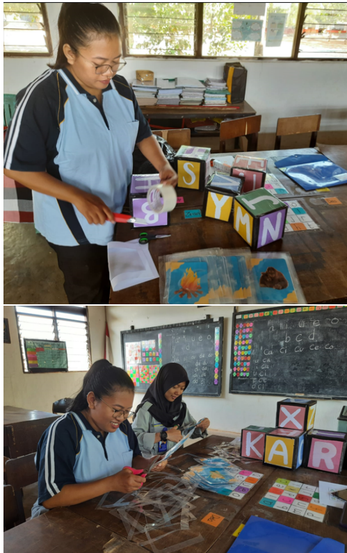
Gambar 4: Proses pemberian huruf pada dadu.

wat di sekolah yang sama. Diskusi juga dilakukan dengan beberapa nara sumber yang ahli di dalam pembuatan media pembelajaran. Berdasarkan hasil-hasil diskusi maka diperoleh masukan terkait ukuran dan bahan kartu gambar sebaiknya dipilih yang tahan lama, dadu huruf dibuat lebih rapi. Beberapa musik disarankan untuk dipilih. Sedangkan ukuran dan warna pada dadu huruf disebutkan sudah baik. Dapat disimpulkan bahwa permainan Kabar Dayang memenuhi syarat validitas.