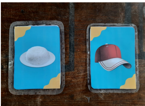
Gambar 1: Contoh tampak bagian depan kartu.