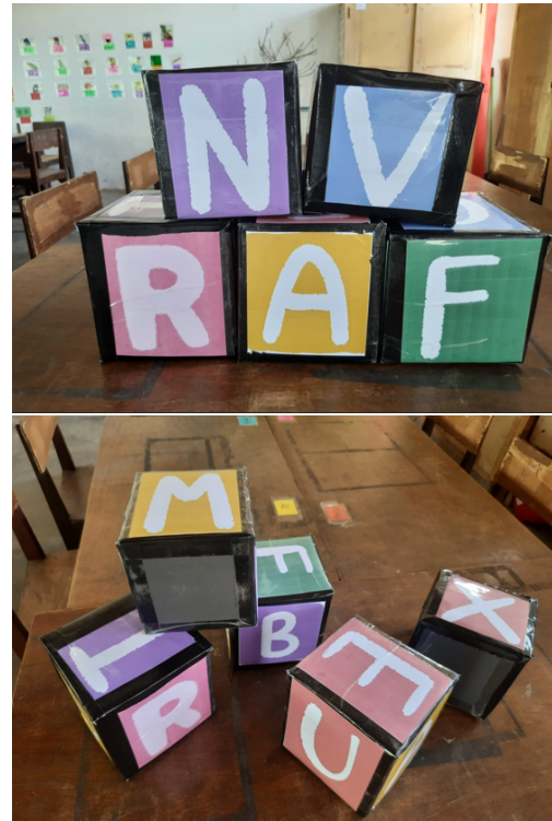
Gambar 5: Contoh huruf dadu.

Implementasi permainan Kabar Dayang dilaksanakan di SD kelas 1A di mana terdapat 17 peserta didik. Pembelajaran berlangsung dalam suasana bermain. Tahapan implementasi terdiri dari per-