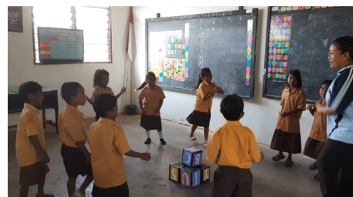
Gambar 6: Implementasi permainan di ruang kelas.

siapan dan pelaksanaan. Pada tahapan persiapan, dilakukan perencanaan pelaksanaan proyek, guru melakukan observasi untuk memahami gaya belajar peserta didik (audiotori, visual, audiovisual, kinestetik) dan mengidentifikasi karakteristik umum peserta didik. Pada tahap pelaksanaan, pembelajaran berlangsung di dalam ruang kelas dalam nuansa permainan. Pelaksanaan permainan di ruang kelas cukup luas untuk pergerakan peserta didik. Beri-